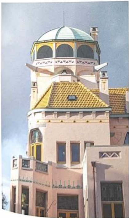
Jachtslot Mookerheide is in oude glorie hersteld