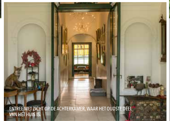
ENTREE MET ZICHT OP DE ACHTERKAMER, WAAR HET OUDSTE DEEL VAN HET HUIS IS.