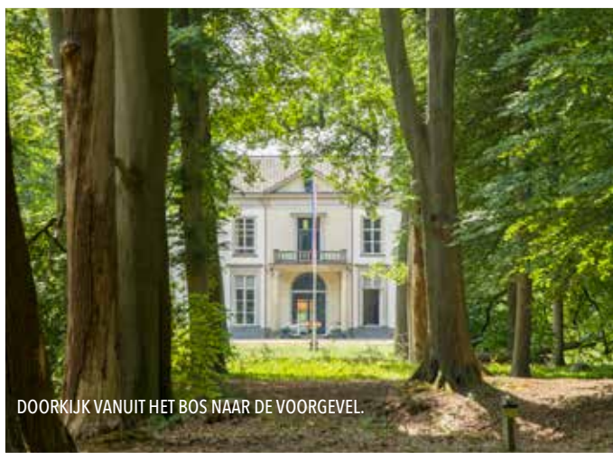
DOORLIJK VANUIT HET BOS NAAR DE VOORGEVEL.