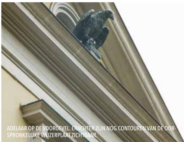
ADELAAR OP DE VOORGEVEL. ERACHTER ZIJN NOG CONTOUREN VAN DE OORSPRONKELIJKE WIJZERPLAAT ZICHTBAAR.